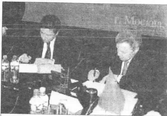
Министр информационных технологий и связи России Леонид Рейман и губернатор Московской области Борис Громов ставят свои подписи под соглашением.

Проект технопарка в Черноголовке, создаваемого на базе су-