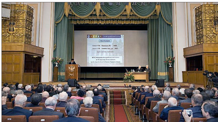
На торжественной церемонии в Центральном доме ученых РАН.