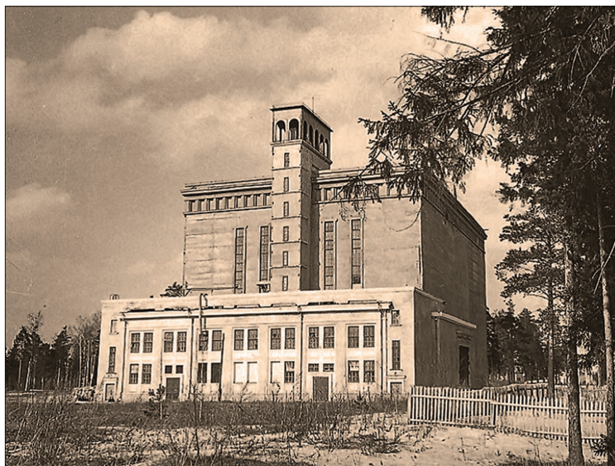
В декабре 2019 года исполнится 70 лет со дня пуска первого ускорителя Дубны.