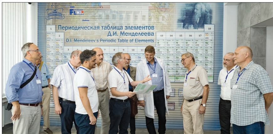
Участники конференции на экскурсии в ЛЯР.