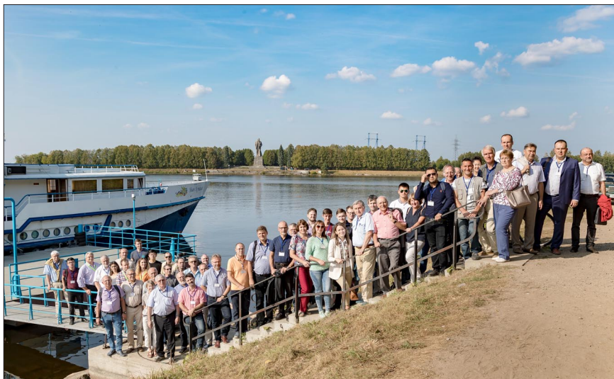
Памятное фото на берегу канала имени Москвы.

Евгений МОЛЧАНОВ, перевод Сергея БОГДАНОВА, фото Елены ПУЗЫНИНОЙ