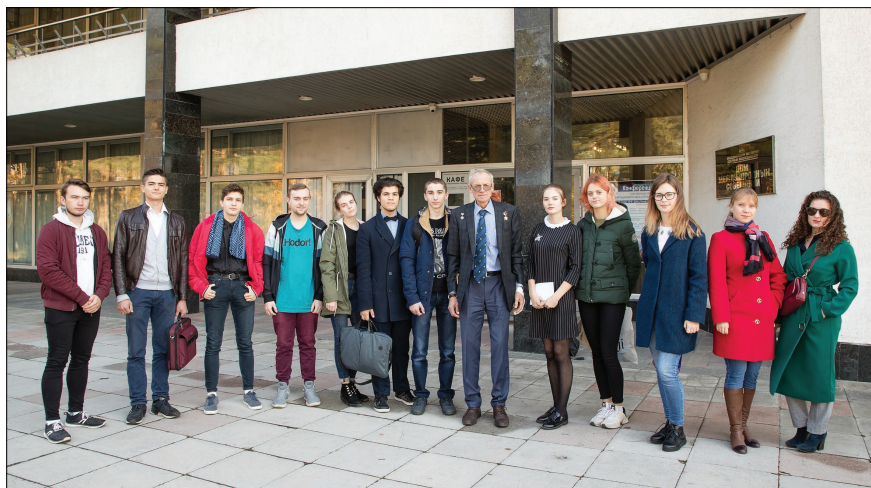
Летчик-космонавт С. В. Авдеев со студентами Университета «Дубна» и молодыми сотрудниками ЛРБ.