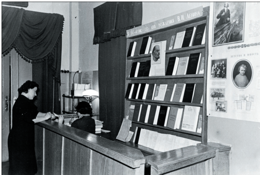
Абонемент в Доме ученых, 1950–1960-е годы.

Кропотливая, тщательная работа предшествует всегда тематическим