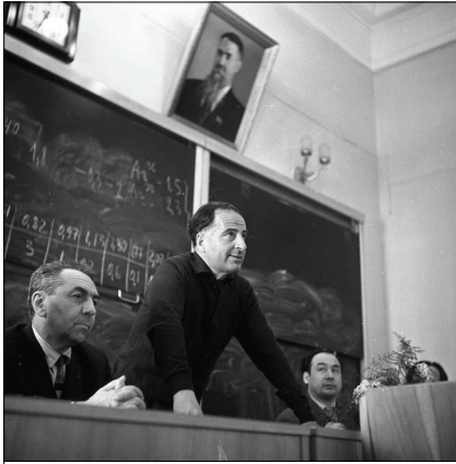
1963 год. На лабораторном семинаре.

О Бруно Максимовиче Понтекорво как ученом написано не раз. Я расскажу немного не о его научной деятельности, а постараюсь передать свои впечатления о человеке, с которым посчастливилось встретиться.