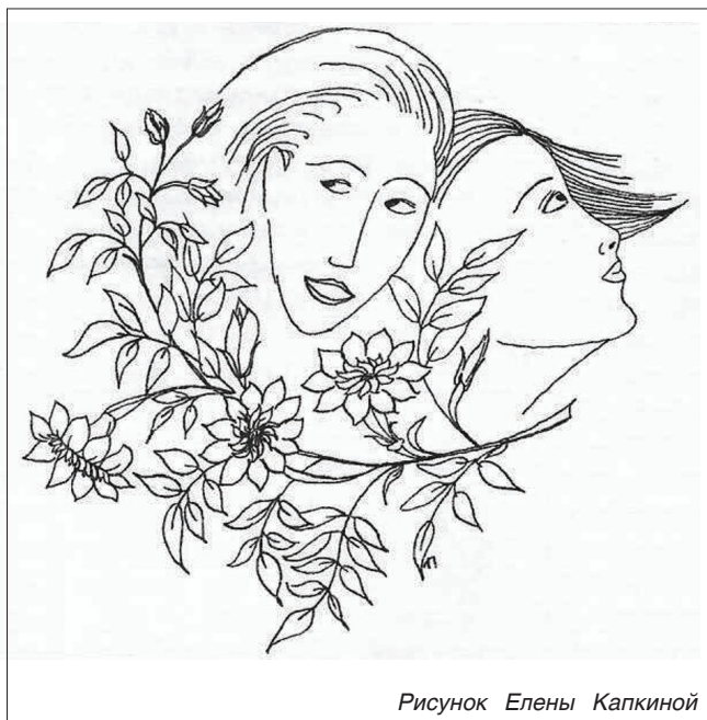
Рисунок Елены Капкиной

Сердечно поздравляю всех представительниц прекрасного пола, работающих в нашем Институте, в университете «Дубна», в научных и образовательных учреждениях города, всех женщин Дубны с Международным женским днем 8 марта.