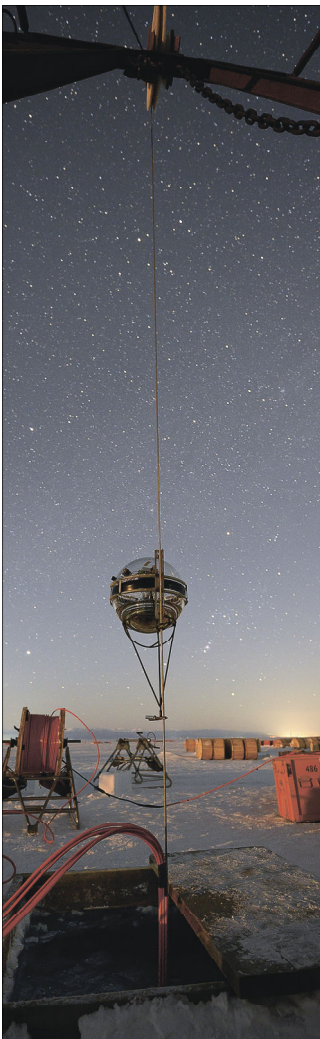
Оптический модуль и звездное небо

В течение зимней экспедиции 2023 года коллаборация Baikal-GVD установила два новых кластера телескопа, провела ремонт и модернизацию уже установленных элементов детектора и продолжила работы по развитию системы передачи данных по оптическим линиям внутри установки.