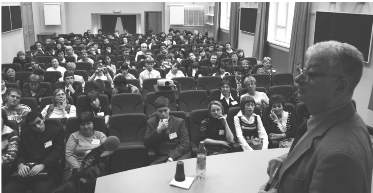
Москва, 10 февраля. Лекция научного руководителя Лаборатории ядерных реакций им. Г. Н. Флерова академика РАН Ю. Ц. Оганесяна в Политехническом музее