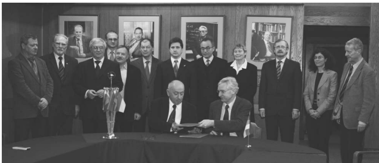
Дубна, 28–29 февраля. Участники 18-го совещания Координационного комитета по выполнению Соглашения между Федеральным министерством образования и научных исследований Германии и ОИЯИ