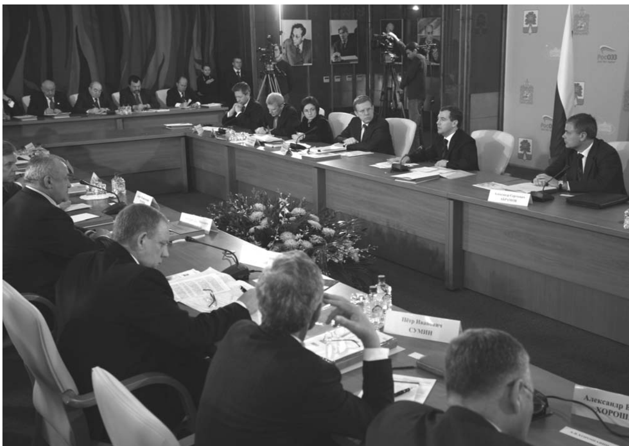
Дом международных совещаний ОИЯИ. Заседание Президиума Государственного совета Российской Федерации