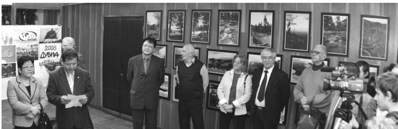
Дубна, 23 ноября. Открытие в ДК «Мир» фотовыставки, посвященной 800-летию образования монгольского государства