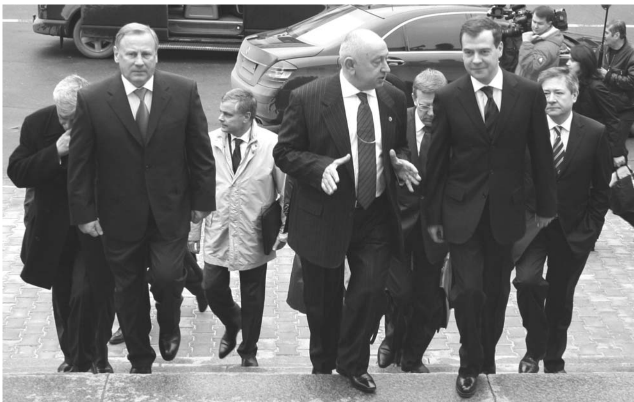
Дубна, 18 апреля. Визит в ОИЯИ Президента России Д. А. Медведева. У входа в Лабораторию ядерных реакций им. Г. Н. Флерова