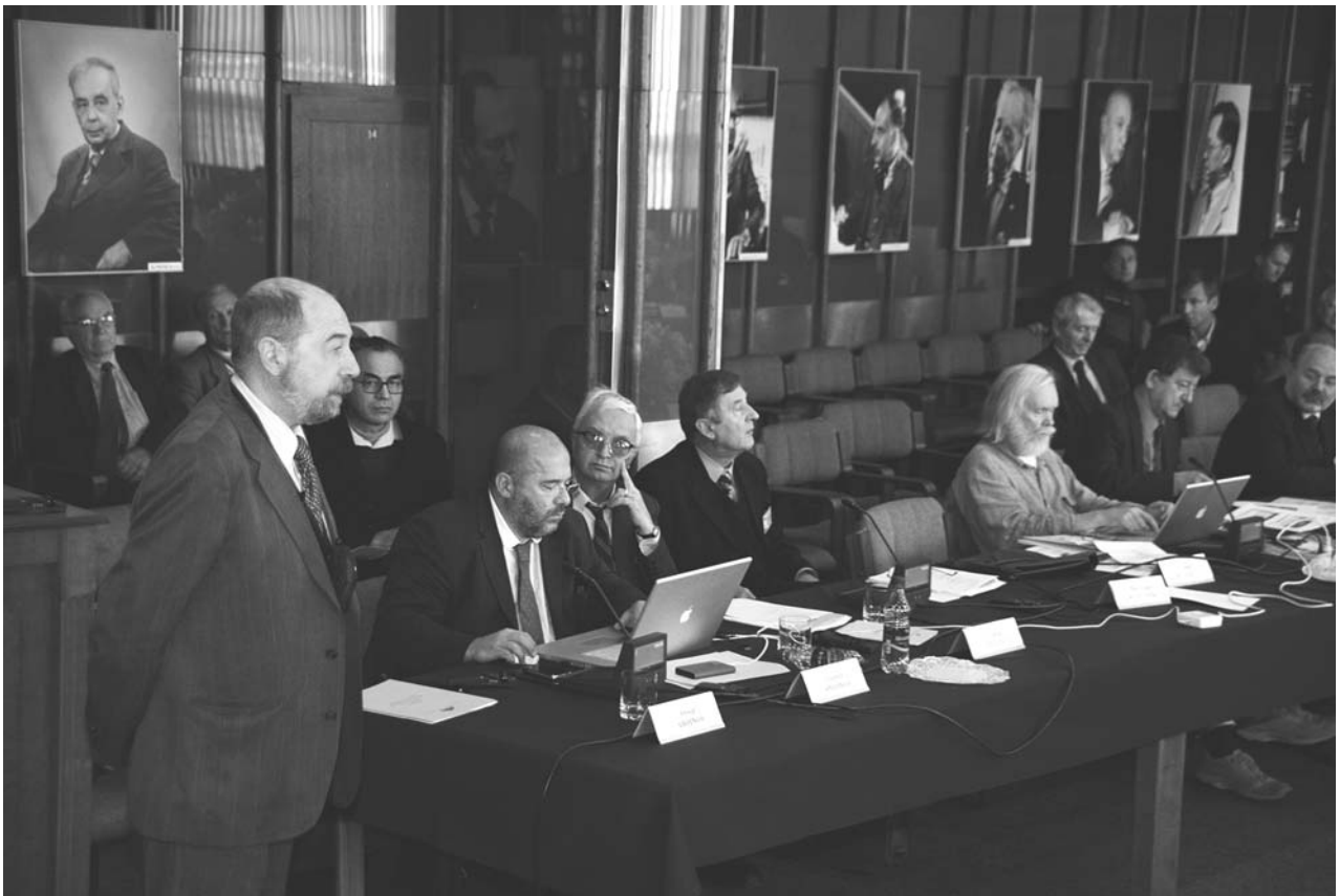
Дубна, 21–22 февраля. 103-я сессия Ученого совета ОИЯИ