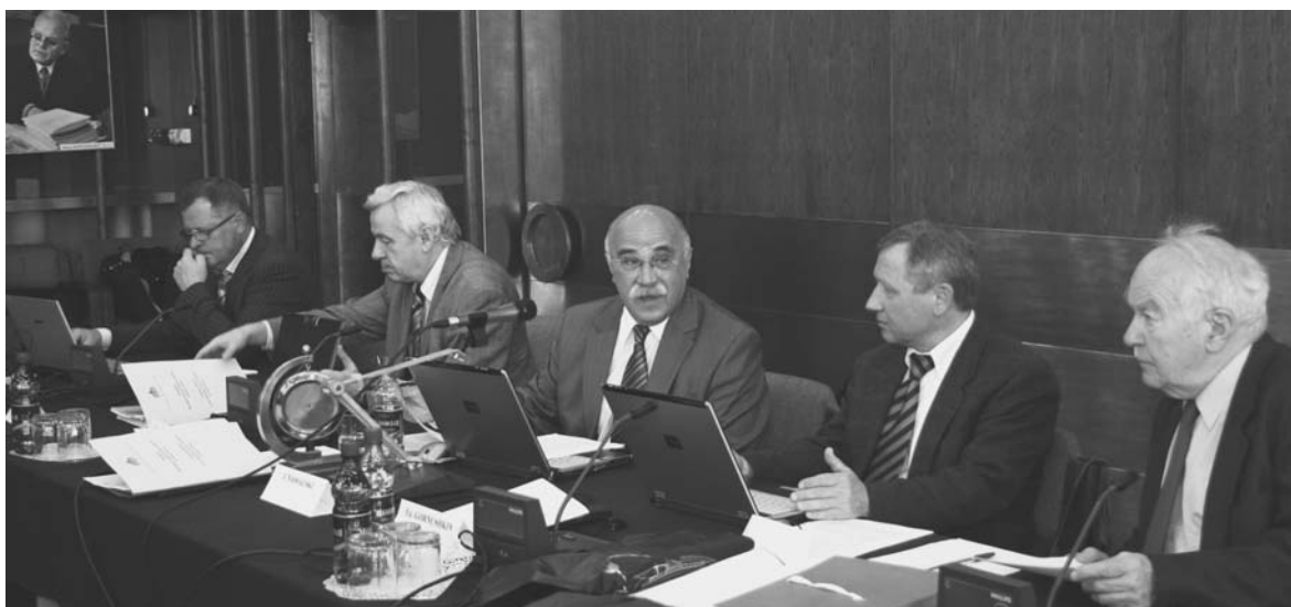
Дубна, 10–11 июня. Сессия Программно-консультативного комитета по физике частиц