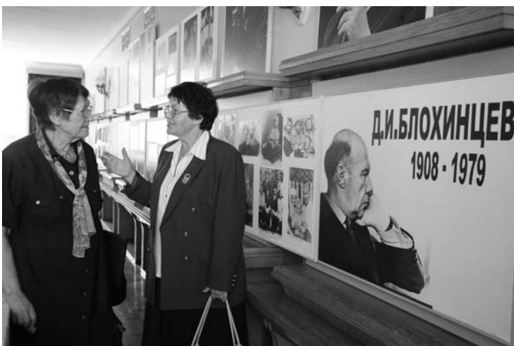
Дубна, 15 января. Семинар, посвященный 100-летию со дня рождения первого директора ОИЯИ члена-корреспондента АН СССР Д. И. Блохинцева