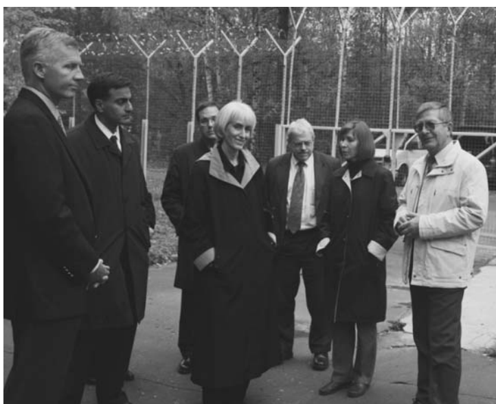
Дубна, 24 сентября. Посещение ОИЯИ делегацией Комиссии Конгресса США по предотвращению распространения оружия массового поражения и терроризма во главе с Уэнди Шерман (в центре)