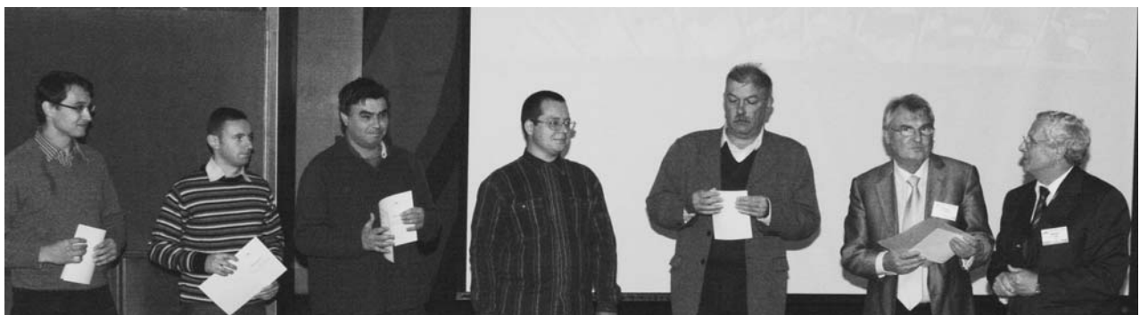
Дубна, 25–26 сентября. 104-я сессия Ученого совета