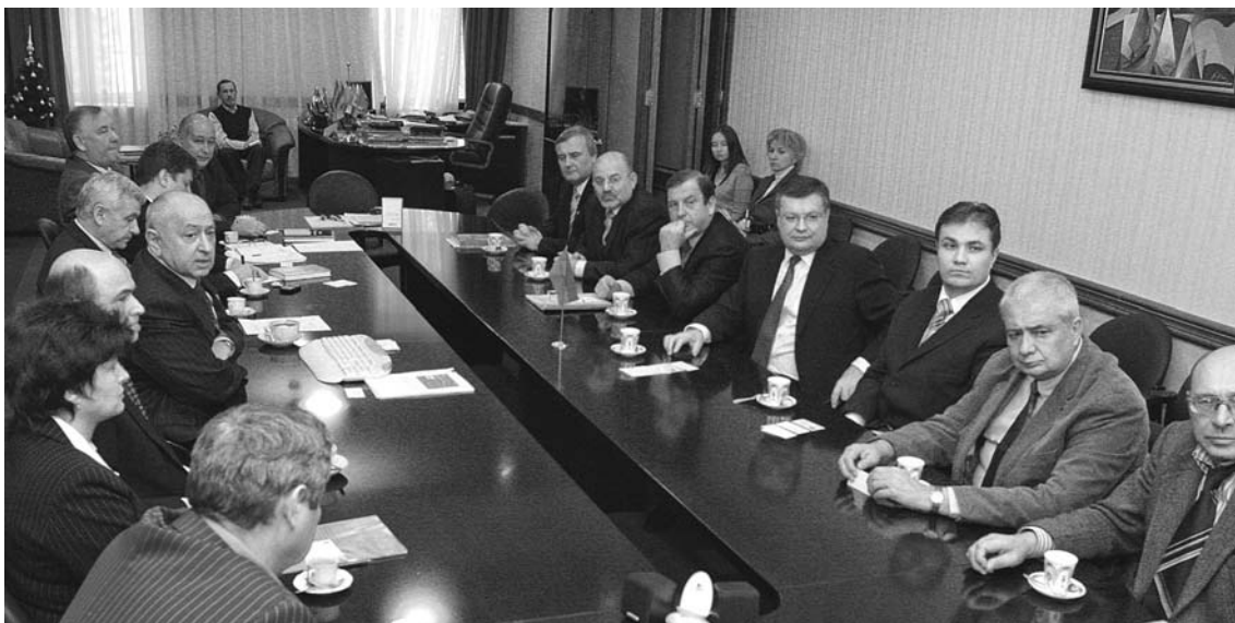
Дубна, 19 декабря. Визит в ОИЯИ делегации Украины во главе с чрезвычайным и полномочным послом Украины в Российской Федерации, первым заместителем секретаря Совета национальной безопасности и обороны Украины Константином Грищенко. Беседа в дирекции Института