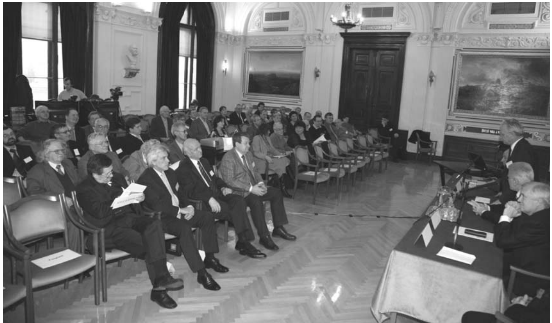
Будапешт, 3–7 декабря. Дни ОИЯИ в Венгрии в рамках сотрудничества ОИЯИ с Венгерской академией наук