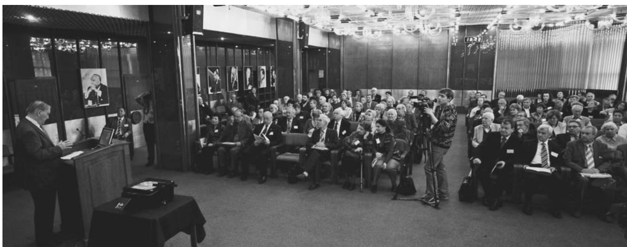
Дубна, 23–24 октября. Международный семинар, посвященный 100-летию со дня рождения лауреата Нобелевской премии академика И. М. Франка