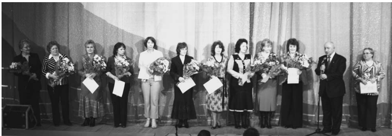
Дубна, 15 марта. Вручение грантов ОИЯИ за педагогическое мастерство лучшим учителям города