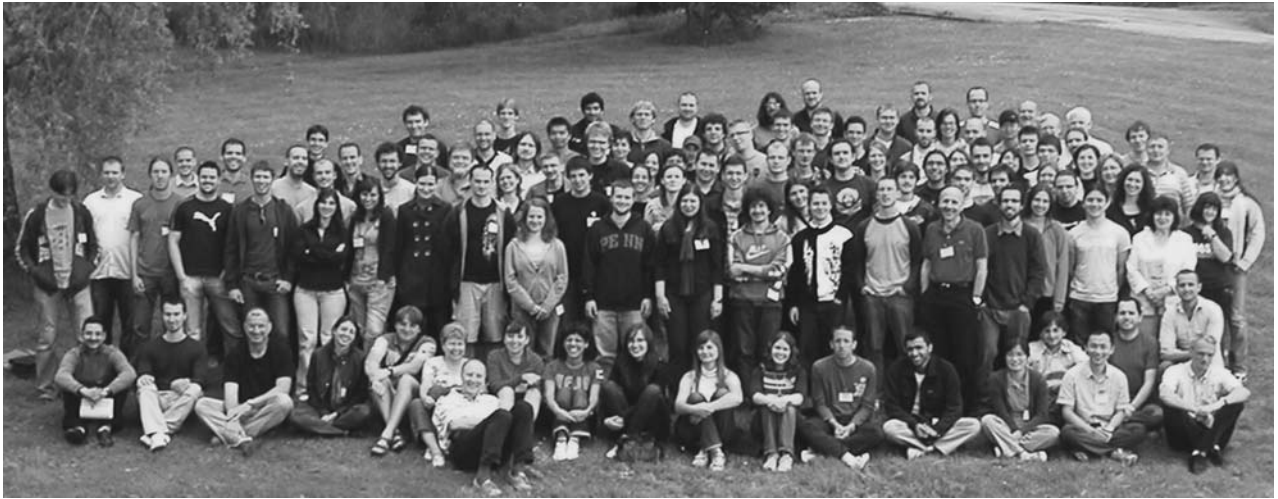
Эрбмон-сюр-Семау (Бельгия), 8–21 июня. Участники Европейской школы по физике высоких энергий