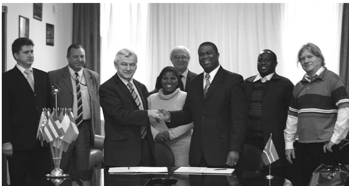
Дубна, 14 ноября. Участники 6-го координационного комитета по сотрудничеству ОИЯИ–ЮАР