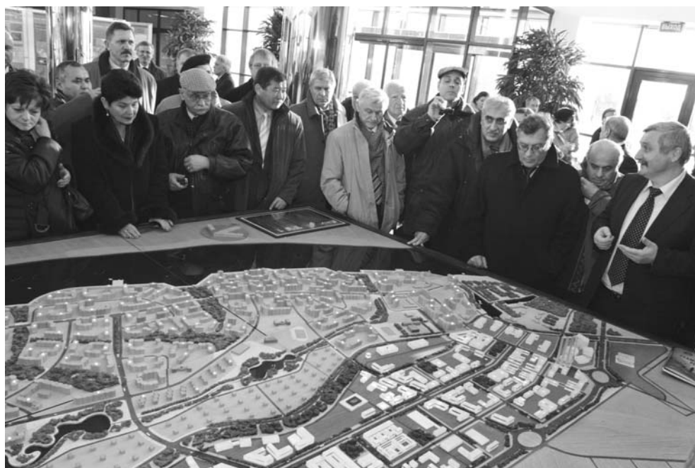
Дубна, 21–22 ноября. Сессия Комитета полномочных представителей правительств государств-членов ОИЯИ