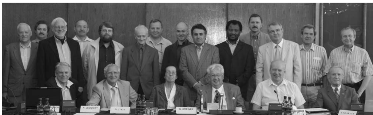
Дубна, 19–20 июня. Сессия Программно-консультативного комитета по ядерной физике