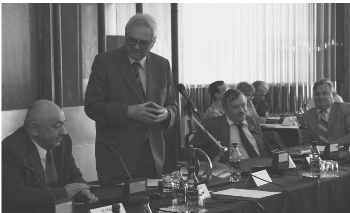
Дубна, 16–17 июня. Сессия Программно-консультативного комитета по физике конденсированных сред