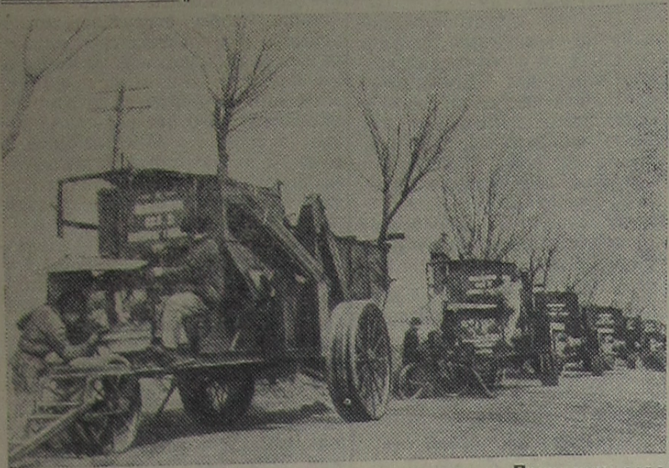
Чанчуньский автомобильный завод совместно с Пекинским заводом сельскохозяйственных машин выпускает зерновые комбайны, которые прежде ввозились в Китай из-за границы.

На снимке: на Пекинском заводе сельскохозяйственных машин. Подготовка комбайнов к отправке.