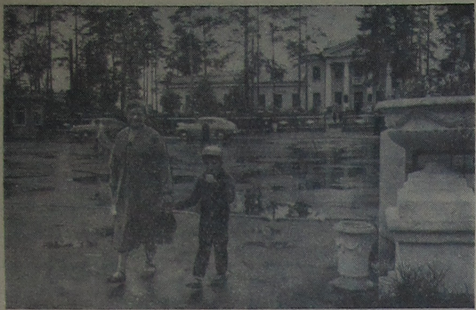
На Центральной улице города.