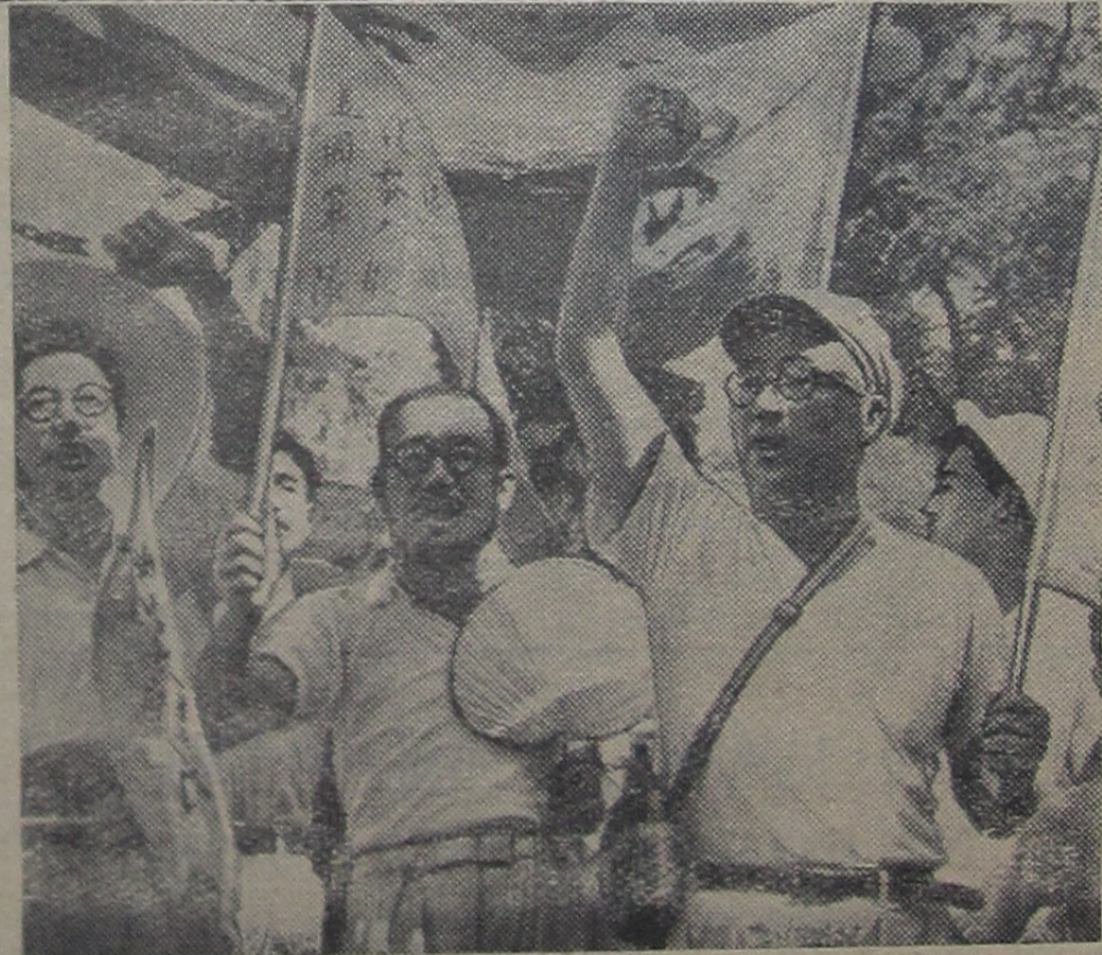
Пекин. 600-миллионный китайский народ гневно осуждает американско-английскую интервенцию в Ливане и Иордании. На снимке: группа преподавателей вузов Пекина во время демонстрации протеста.

гали к помощи работников милиции. В Доме культуры комсомольский патруль следил за тем, чтобы во время танцев все танцевало и вело себя прилично. Несколько пар пришлось вывести и пригласить на беседу. Оказалось, что часть «стиляг», безобразничающих в нашем Доме культуры, приезжает к нам из Ивановки и Кимр, встречаются московские и ленинградские «стиляги». Прошедший рейд был первым в Дубне. Он показал, что такие рейды надо проводить регулярно, в них должно участвовать больше комсомольцев и молодежи. Все комсомольцы по-настоящему должны встать за наведение порядка в городе, тогда у нас не будет ни хулиганов, ни «стиляг».