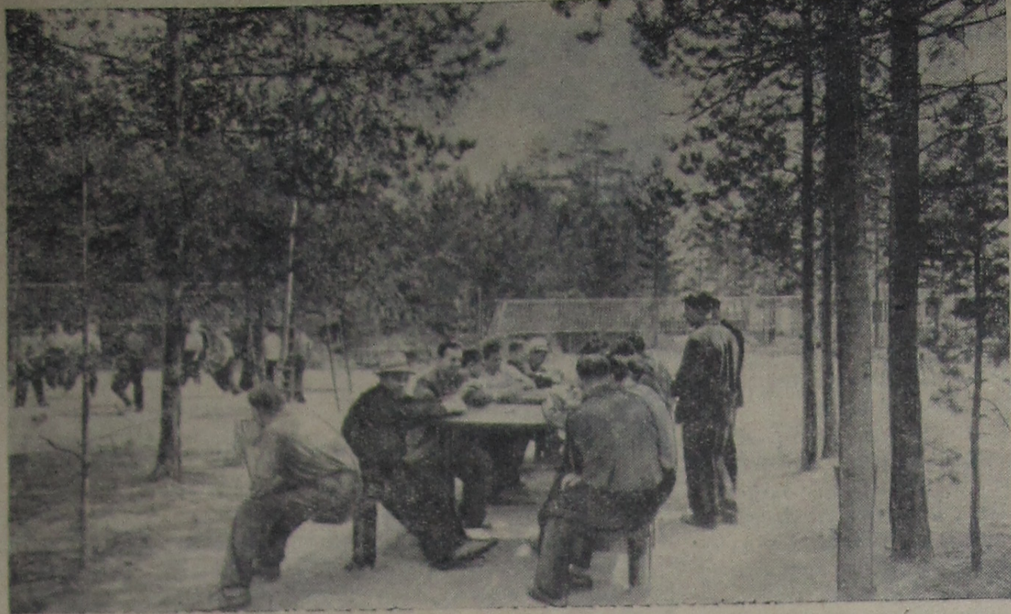
Весело и культурно проводит свободное от работы время коллектив экспериментальных мастерских ЛЯП. Своими руками они построили спорт ордок. На снимке: рабочие мастерских во время обеденного перерыва.