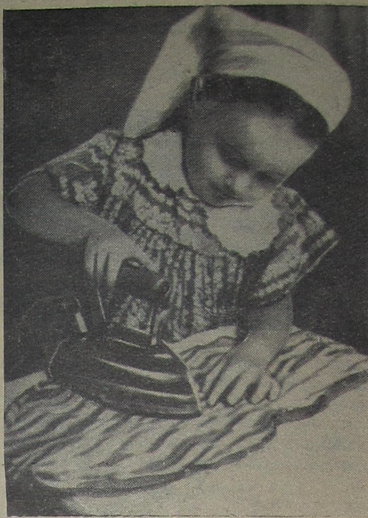
Дочка маме помогала, Постирала — гладить стала.

Вот почему в странах — участницах СЕАТО усиливается борьба за проведение независимой политики, за роспуск этого агрессивного блока, за пресечение американских провокаций. Н. ХОХЛОВ.