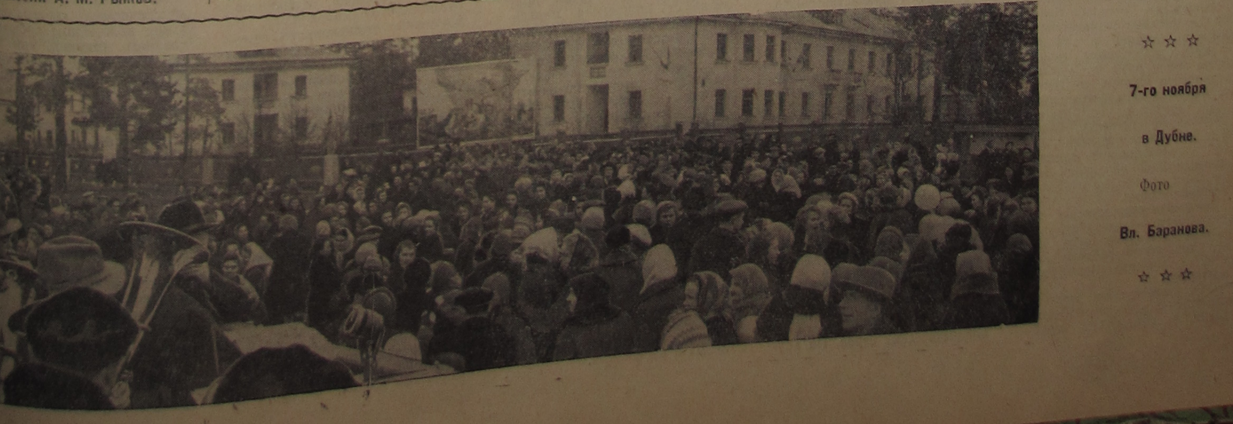
☆☆☆ 7-го ноября в Дубно. ☆☆☆

Пленум ГК КПСС. Пленум избрал членами бюро и секретарями ГК КПСС: первым — тов. А. Г. Сиворцова, вторым — тов. Б. Д. Балашова, секретарем тов. А. Г. Амосова. Членами бюро тт. А. Н. Безобразова, Г. С. Казанского, П. И. Панфилова, К. Л. Плюснина, П. С. Сергеева, В. Н. Сергиенно.