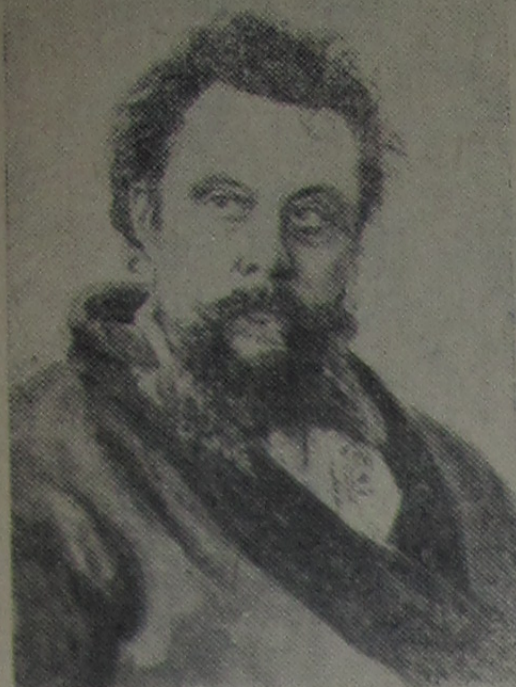
МУСОРСКИЙ Модест Петрович (21 марта 1839—28 марта 1881) — великий русский композитор. Он написал замечательную

оперу «Борис Годунов», являющуюся одной из вершин творчества композитора, затем оперу «Хованщина» — народную музыкальную драму, по его определению — «Сорочинская ярмарка».