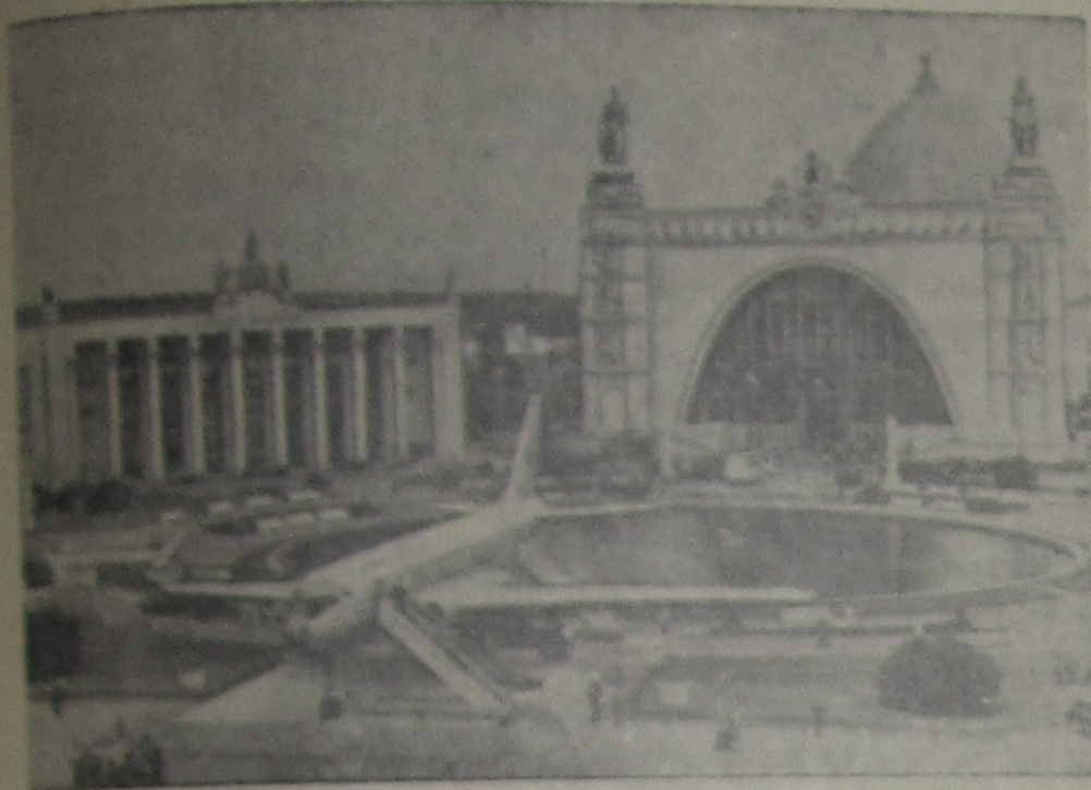
На снимке: Выставка достижений народного хозяйства СССР.