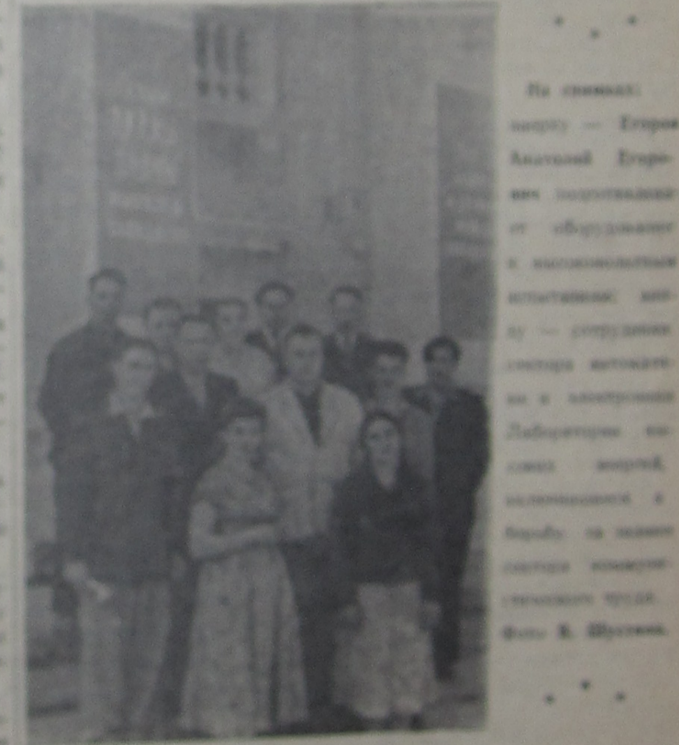
На снимках: секретарь сектора автоматизма и электроники Александр 11 (в центре); секретарь сектора автоматизма и электроники Александр 11 (в центре); секретарь сектора автоматизма и электроники Александр 11 (в центре).