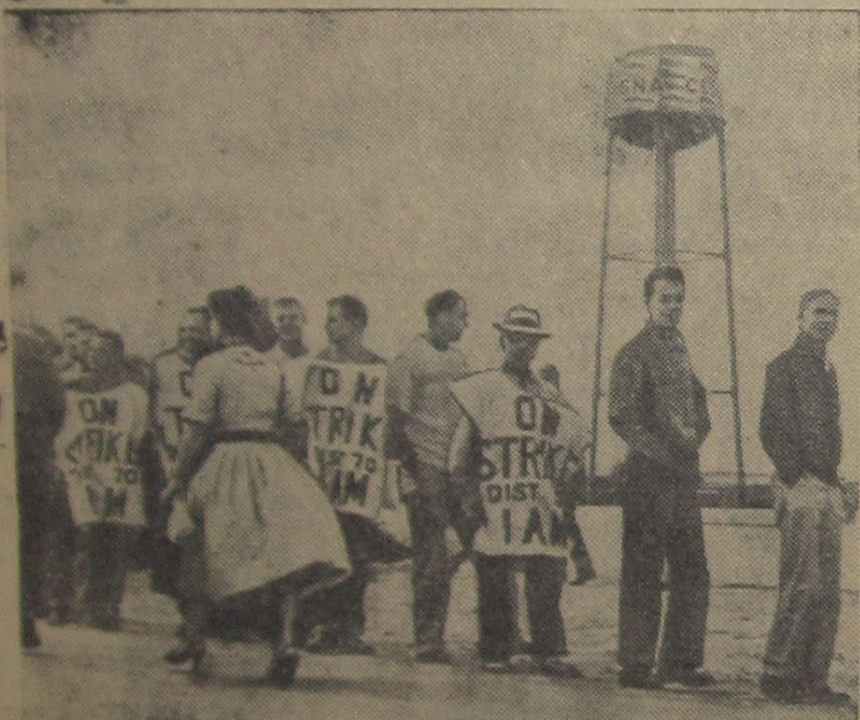
Соединенные Штаты Америки. Недавно объявили забастовку рабочие завода компании «Сессна Эйркрафт» в Уичито (штат Канзас).

На снимке: пикет бастующих около предприятия.