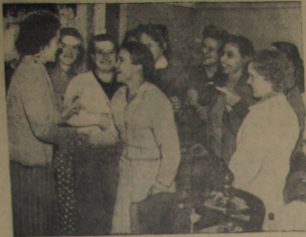
Сотрудницы Лаборатории ядерных проблем тепло проводили своих болгарских подруг, уехавших на родину после двух лет работы в Институте.