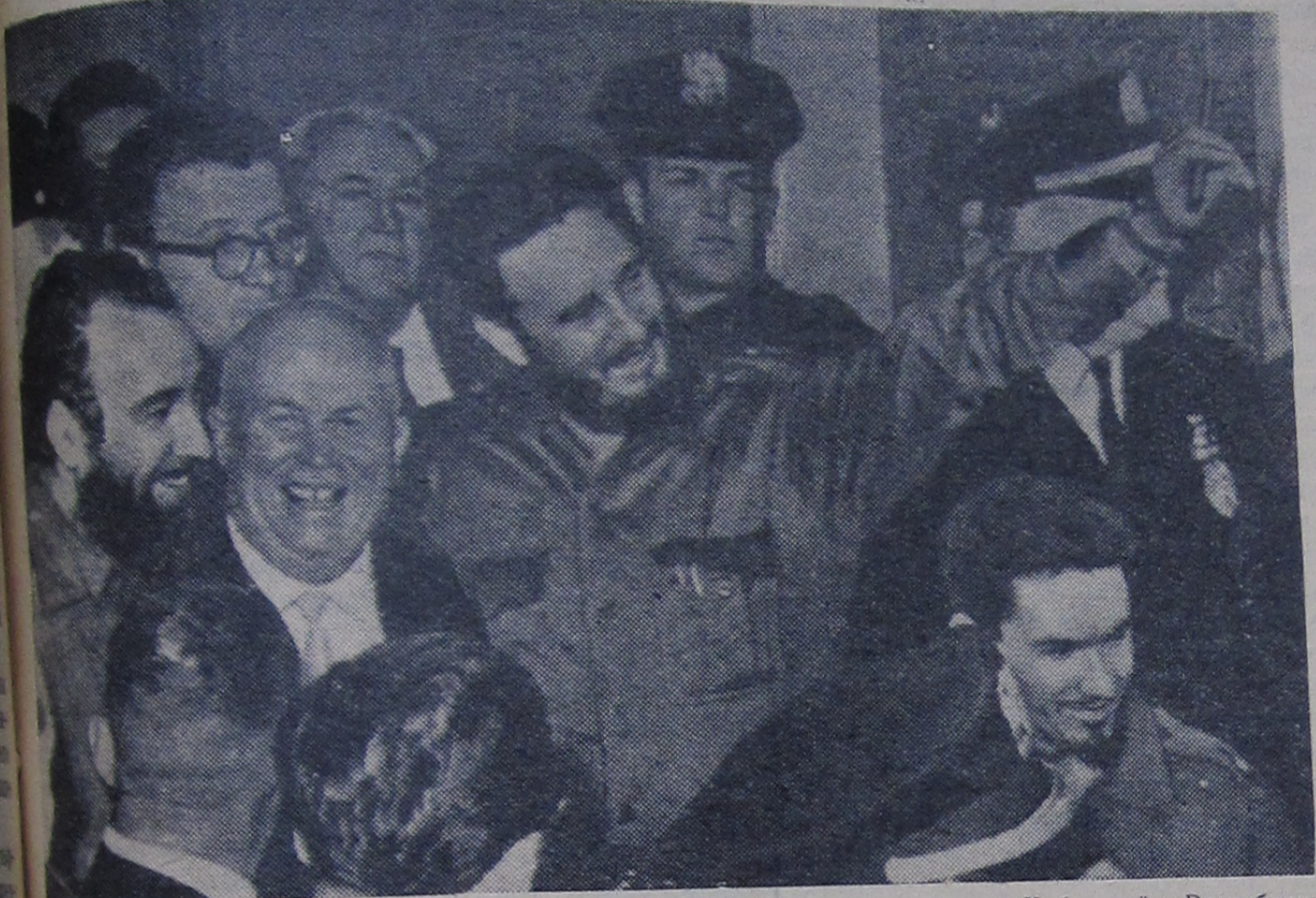
Нью-Йорк. 20 сентября. Встреча Н. С. Хрущева с Премьер-министром Кубинской Республики Фиделем Кастро в отеле «Терезия» в Гарлеме.