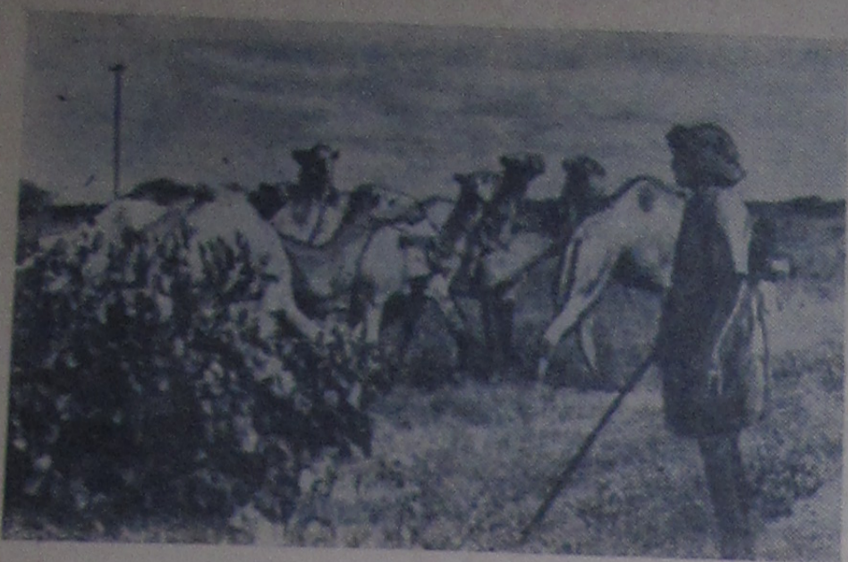
Сомалийская республика. На снимке: верблюды на пастбище.