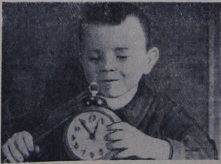
Ремонт с гарантией.