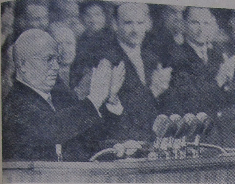
Москва. Многотысячный митинг трудящихся столицы во Дворце спорта, посвященный работе советской делегации на XV сессии Генеральной Ассамблеи ООН. На трибуне Н. С. Хрущев.