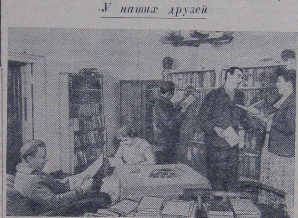
Германская Демократическая Республика. В библиотеке Дома культуры в деревне Круге, район Бад Фрейенвальде.