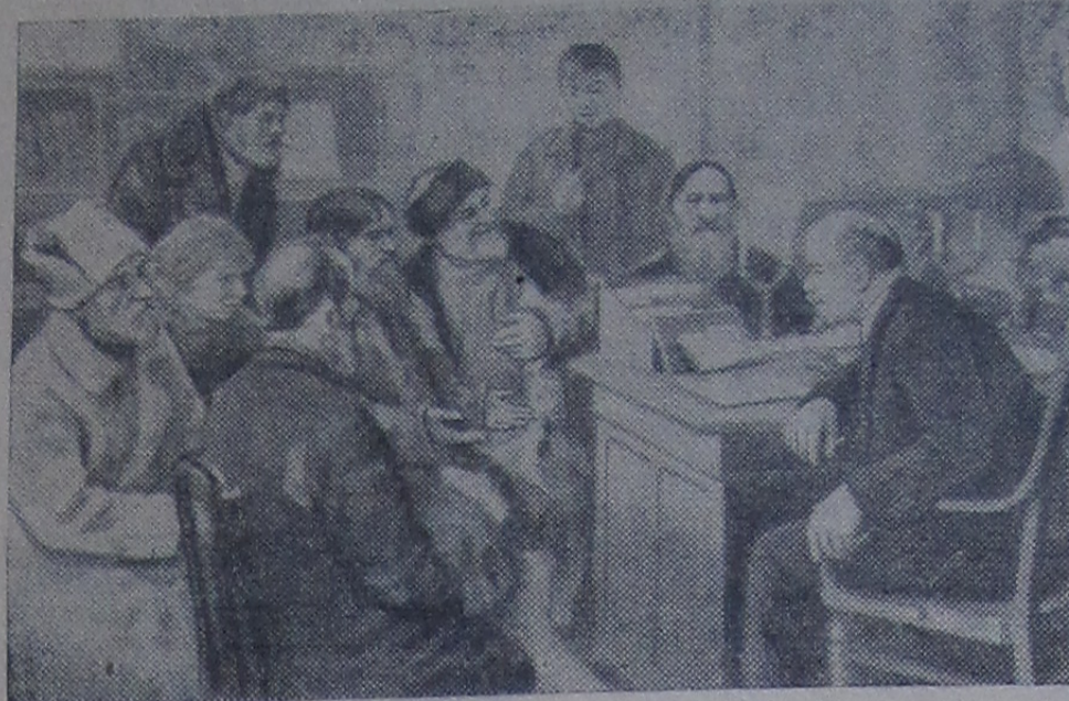
В. И. Ленин беседует с крестьянами. (С картины худ. М. Соколова).