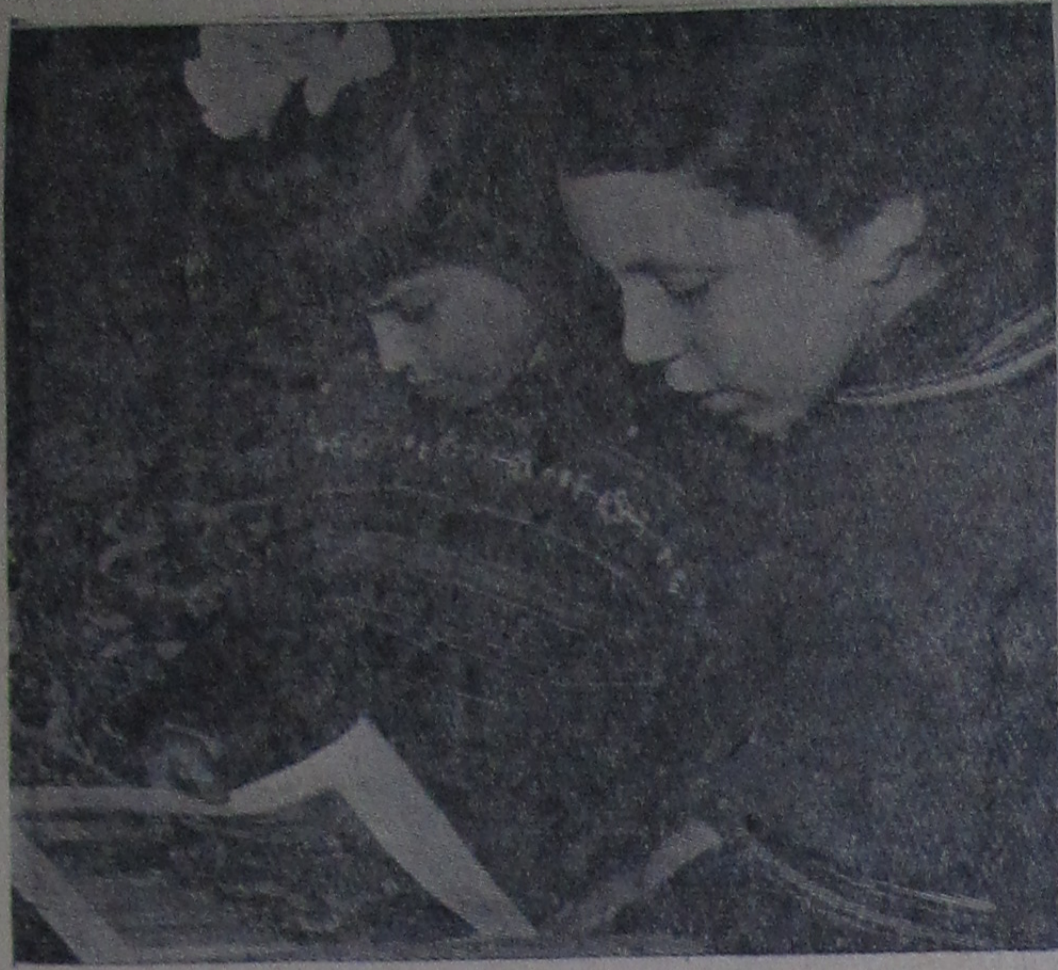
Книжка о Ленине.