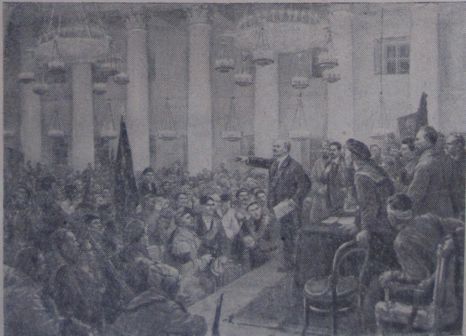
«Выступление В. И. Ленина на II Всероссийском съезде Советов». Картина художника В. Серова.

Возвращались они домой, полные волнующих впечатлений.