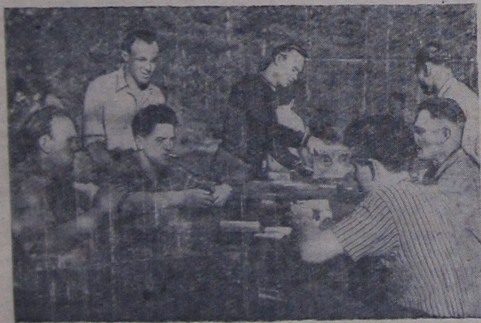
В обеденный перерыв на площадке Лаборатории ядерных проблем.