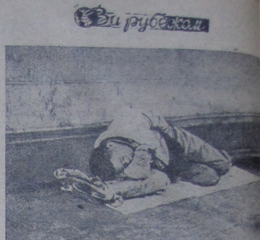
МИНИСТЕРСТВО труда Японии опубликовало недавно книгу, в которой отмечается, что в настоящее время в Японии около 7.700 тысяч безработных живет в исключительно тяжелых условиях. 1.600 тысяч семей безработных не получают никакой помощи от правительства.

Первая программа 12.00 — По страницам журнала «Для вас, женщины». 12.30 — «Под Воронежем у нас». Выступление Воронежского русского народного хора. Художественный руководитель К. Масалитинов. 12.50 — Последние известия. 18.15 — Последние известия. 18.30 — Для школьников. «Клуб юных путешественников». Рассказ об экспедициях Дома пионеров Московского района. 19.00 — Ответы на вопросы трудящихся. Здравоохранение. 19.30 — «Россия — Родина моя». Театрализованный концерт. Передача из Телевизионно-