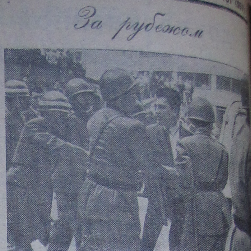
В столице Колумбии городе Боготе состоялась забастовка банковских служащих. Сотрудники банков потребовали улучшения условий труда. Правительство объявило забастовку незаконной. Полицией совершили нападения на митинги и пикеты бастующих. Профсоюзных руководителей арестован. На снимке: арест бастующего.

Отправление из Дубны 5 и 8 ноября — 14-30 и 21-32. 7 и 9 ноября — 3-53. Отправление из Москвы 5 ноября — 10-25 и 18-25 6 ноября — 22-50 8 ноября — 10-25, 18-25 и 22-50 Во избежание очередей у касс перед отправлением поезда можно приобретать билеты на станциях Дубна и Б. Волга накануне отправления поезда с 19 до 21 часа.