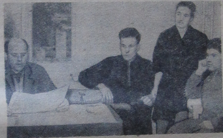
В эти дни на предприятиях и в учреждениях нашего города тщательно изучаются решения XXII съезда КПСС.