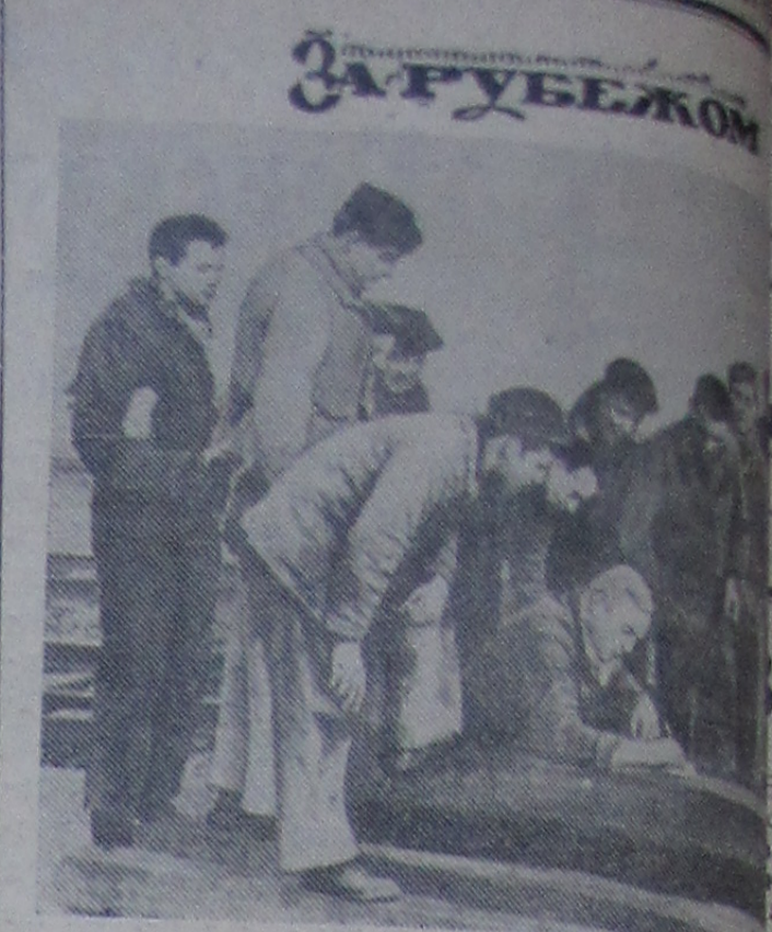
Трудящиеся Франции усиливают борьбу за свержение войны в Алжире, продолжающейся второй год. На снимке: железнодорожники Лиона проводят резолюцией, требующей прекращения позорного Алжира.