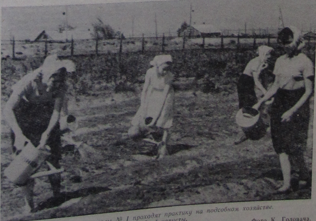
Учащиеся 8 «А» класса школы № 1 проходят практику на подсобном хозяйстве. На снимке: школьники за поливкой поздней капусты.