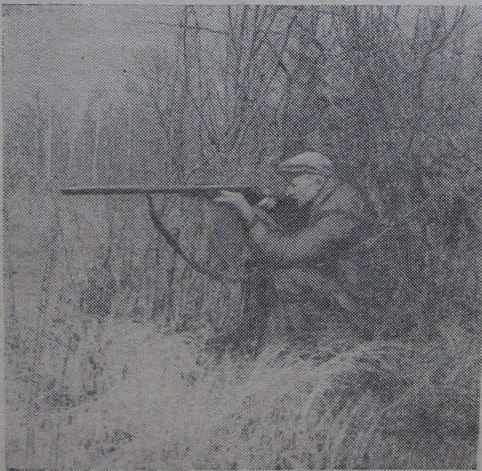
По тетеревам.

Повесть написана живо, волнующе. Юноши и девушки с интересом прочтут ее.