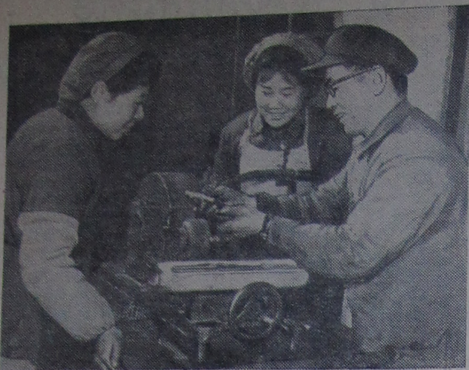
КИТАЙСКАЯ НАРОДНАЯ РЕСПУБЛИКА. Шлифовщики Нанкинского завода мерительного и режущего инструмента создали недавно два бесцентровых шлифовальных станка, заменивших ручную обработку режущего инструмента. Новые станки значительно повысили качество обработки. На снимке: проверка качества сверл, обработанных на новом оборудовании.