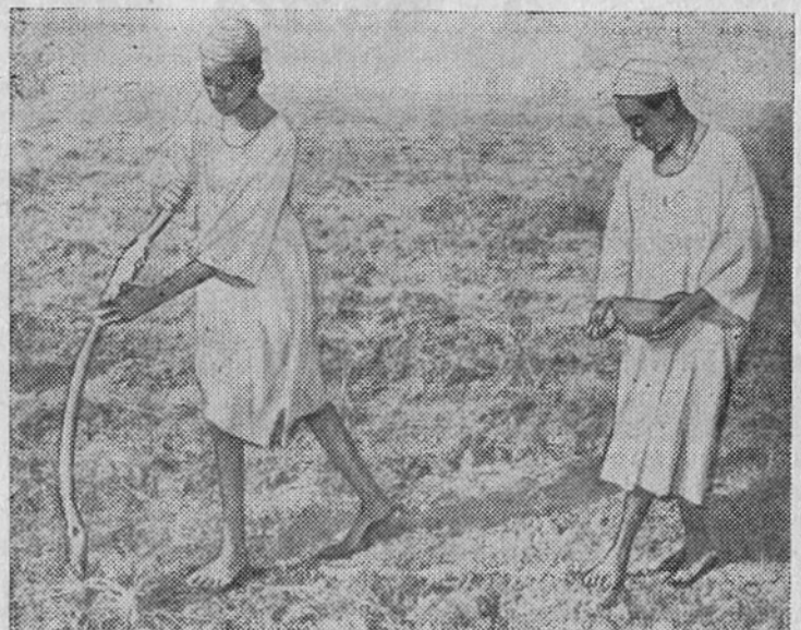
В Судане таким примитивным способом производится сев — посредством простой палки «селуки». Ею делаются углубления в земле, а затем бросают в них семена. На снимке: сев на суданских полях.