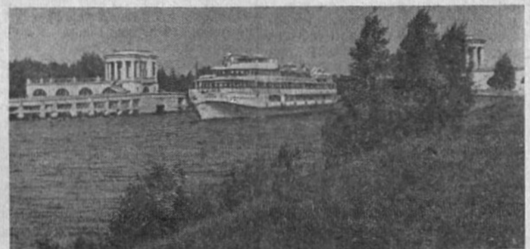
Тысячи туристов на комфортабельных быстроходных речных судах совершают путешествия от столицы по каналу имени Москвы, Рыбинскому водохранилищу, по Волге к Горькому, Волгограду, к Астрахани.

Выключатели предназначены для сверхмощной линии электропередачи напряжением в 500 тысяч вольт.