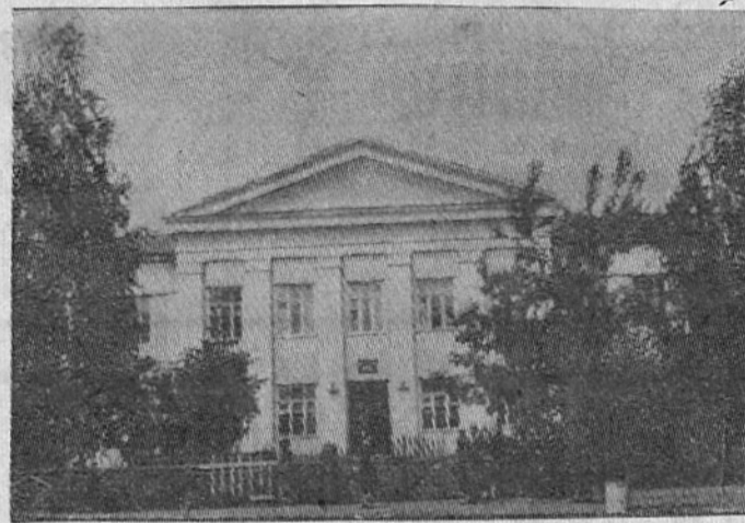
На снимке: школа № 1.