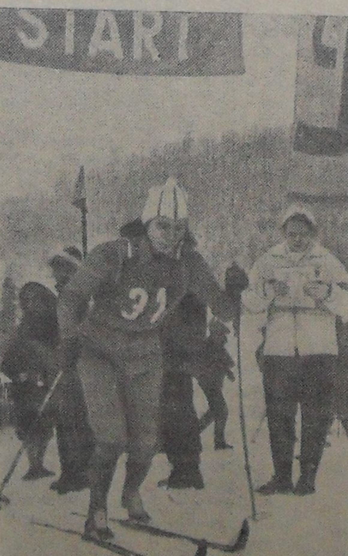
Занопане. Советская спортсменка Алеwtина Колчина — чемпионка мира по лыжам на 5-километровой дистанции. Эту дистанцию она прошла за 19 минут 28,6 секунды.

12.00 — Кинопрограмма новых хроникально-документальных и научно-популярных киноочерков: «Живая вода», «Наука и техника», «Ренато Гуттузо», «Рождение города». 12.45 — Телевизионные новости. 17.50 — Программа передач. 17.55 — Для школьников. «Сотня миллионов лет назад». Как образовался торф и каменный уголь. 18.15 — Телевизионные новости. 18.25 — Ответы на вопросы трудящихся по выборам в Верховный Совет СССР. Репортаж из агитпункта. 19.05 — Телевизионный журнал «Молодость». Страницы: «Москва — комсомольскому съезду», «Портрет современника», «Вуз на ко-