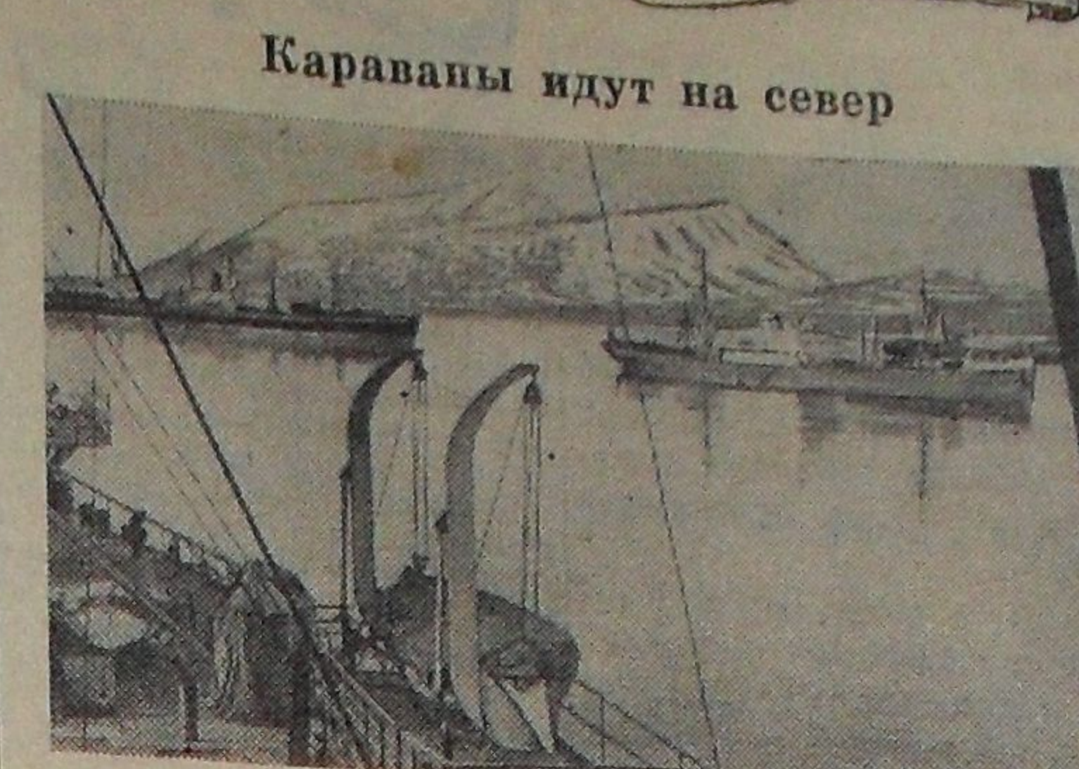
Караваны идут на север Бухта Провидения, Здесь формируются караваны мор- ских судов, которые доставят грузы, продовольствие, техни- ку полярникам и горнякам, оленеводам и зверобоям Чукот- ки. По проложенному мощными ледоколами пути океанские корабли прошли в далекую бухту, чтобы разойтись отсюда караванами в северные порты Певек, Анадырь, Эгвекинот. На снимке: морские суда Дальневосточного пароходства в бухте Провидения.

Морской крылатый корабль Судостроители завода «Красное Сормово» (Горький) спустили на воду 300-местный морской теплоход на подводных крыльях «Вихрь». Корабль имеет новую схему устройства подводных крыль- ев, обеспечивающих надежность плавания в морских условиях. Его скорость 70—80 километров в час. На судне три комфорта- бельных пассажирских салона с откидными креслами.