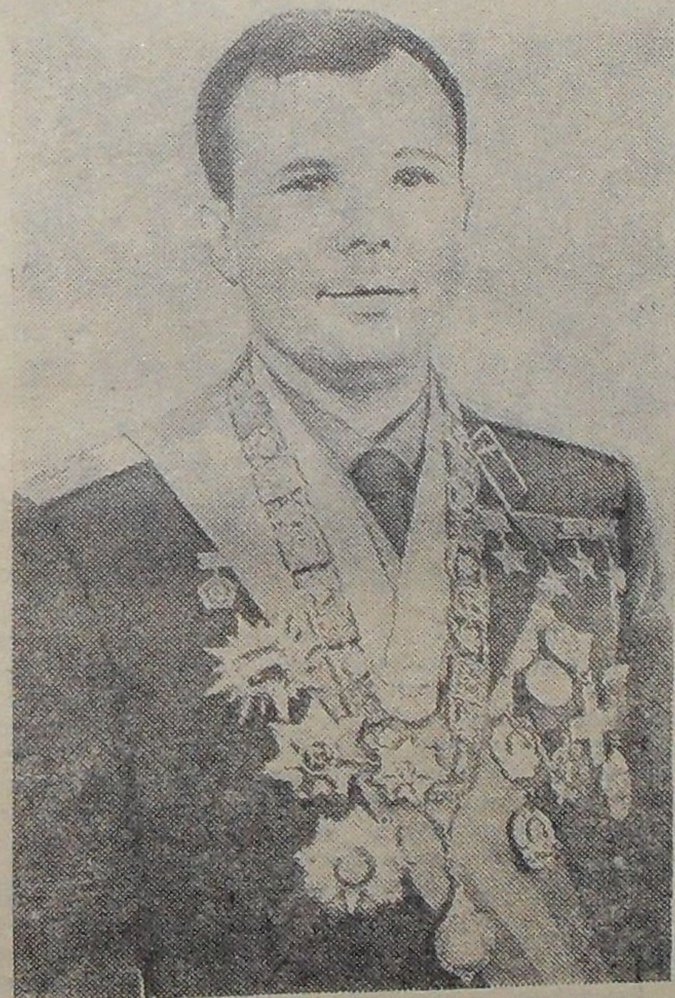
Первый в мире космонавт Юрий ГАГАРИН.