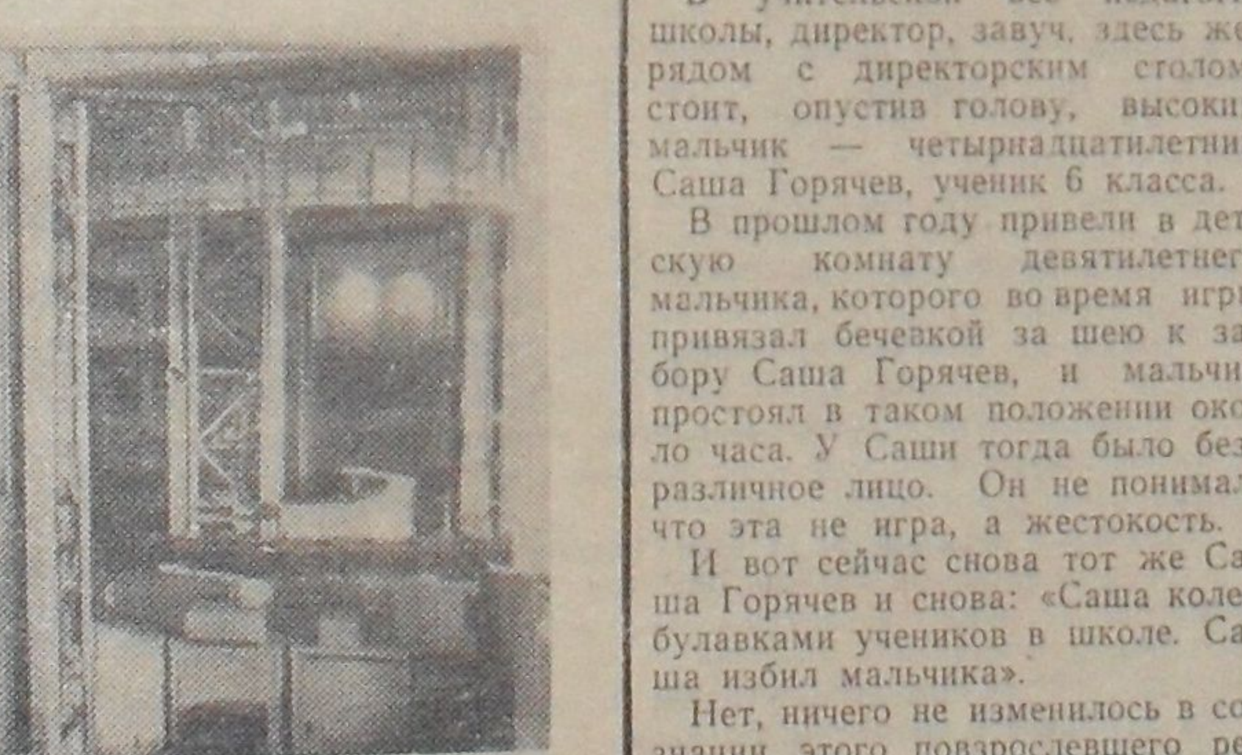
К. И. ДОМБРОВСКИЙ (справа) готовит лаборантку ЛЯП ЧЕРКУНОВУ к съемке кадра по обработке физических данных на автомате.