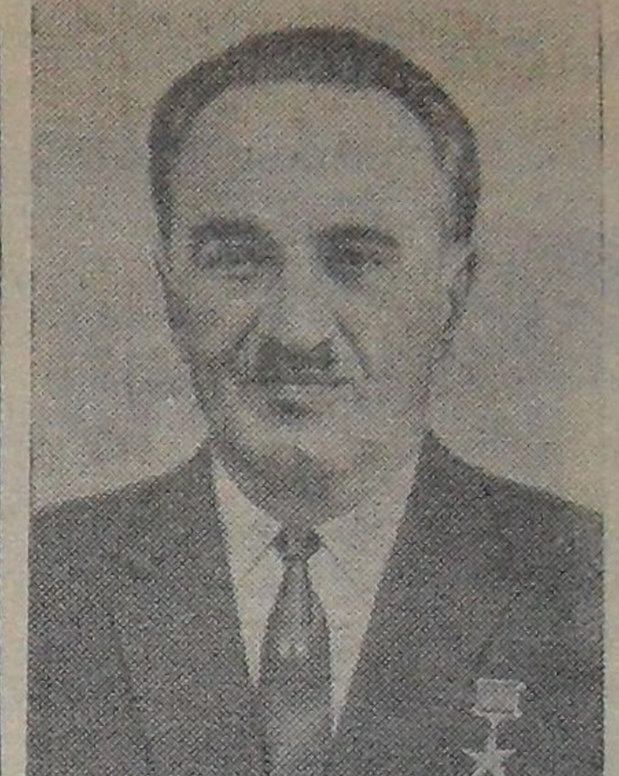
25 ноября исполняется 70 лет Председателю Президиума Верховного Совета СССР, члену Президиума ЦК КПСС А. И. Микояну.