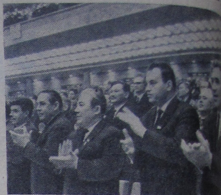
Москва. XXIII съезд Коммунистической партии Советского Союза. На снимке: в зале заседаний.

Во второй день работы съезда начались прения по докладу. Выступили товарищи Н. Г. Егорычев, П. Е. Шелест, В. С. Толстиков, Ш. Р. Рашидов, Ф. С. Горячев и многие другие.