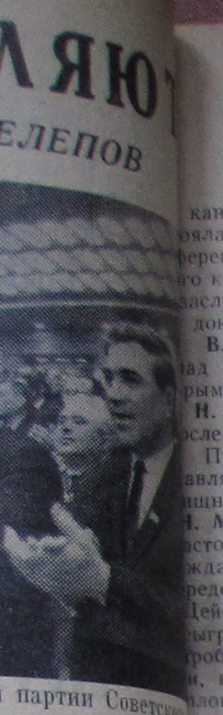
Фотокорреспондент партии Советских рабочих депутатов