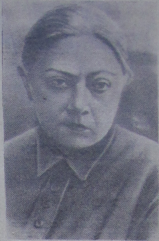
На снимке: Н. К. Крупская. 1924 г.

Всю свою жизнь Н. К. Крупская преданно боролась за светлые идеалы марксизма-ленинизма. Ей довелось увидеть созданное по плану Ленина социалистическое общество в СССР, где и поныне ее научное наследие оказывает неоценимую помощь в деле воспитания нового человека.