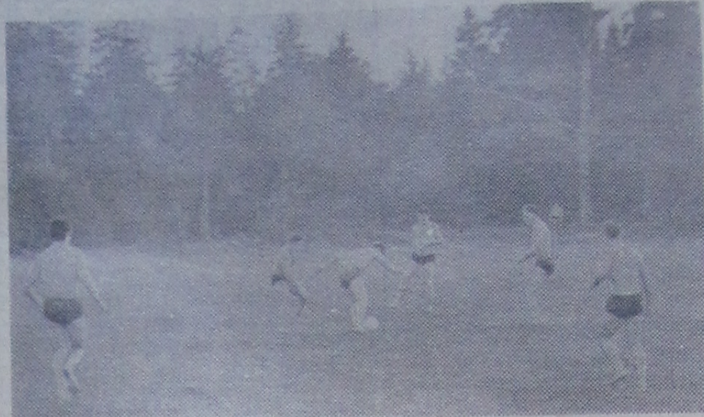
ПЕРЕД ВСТРЕЧЕЙ ПО ФУТБОЛУ