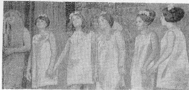
«Они создания тихие, ангельские, на любую работу согласны» «Олимп» на симпозиуме (снимок справа)