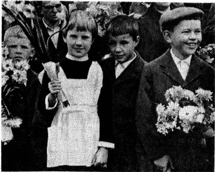
Завтра они снова пойдут в школу.

В обсуждении доклада приняли участие учителя, представители общественных организаций города. Они говорили о том, что их волновало, о важнейших направлениях педагогической деятельности.