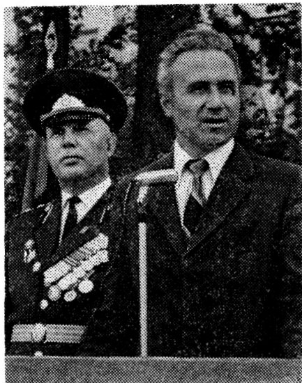
Выпускников поздравил первый секретарь ГК КПСС Ю. С. Кузнецов.