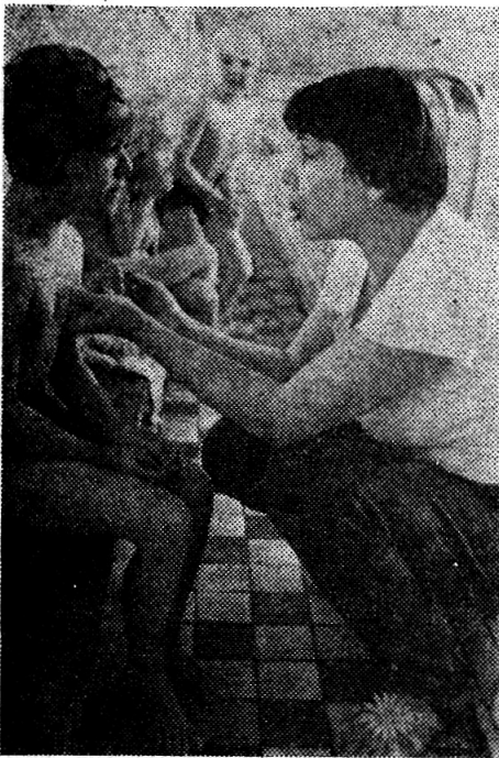
ТРЕНЕР ВСЕГДА РЯДОМ