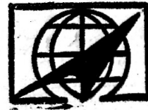
Фото Ю. ТУМАНОВА.

На снимке: в зале прототипа коллективного ускорителя смонтирована начальная часть канала транспортировки ионов.