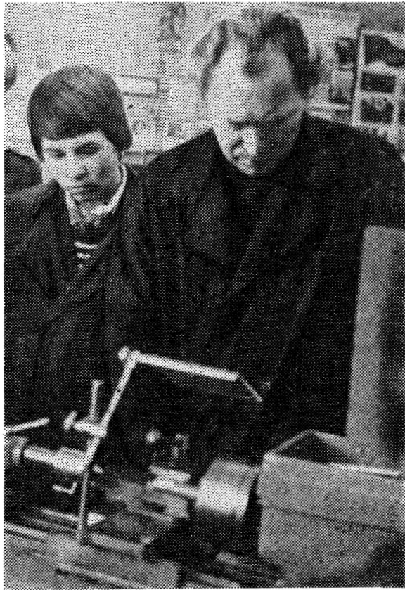
РЯДОМ С НАСТАВНИКОМ.