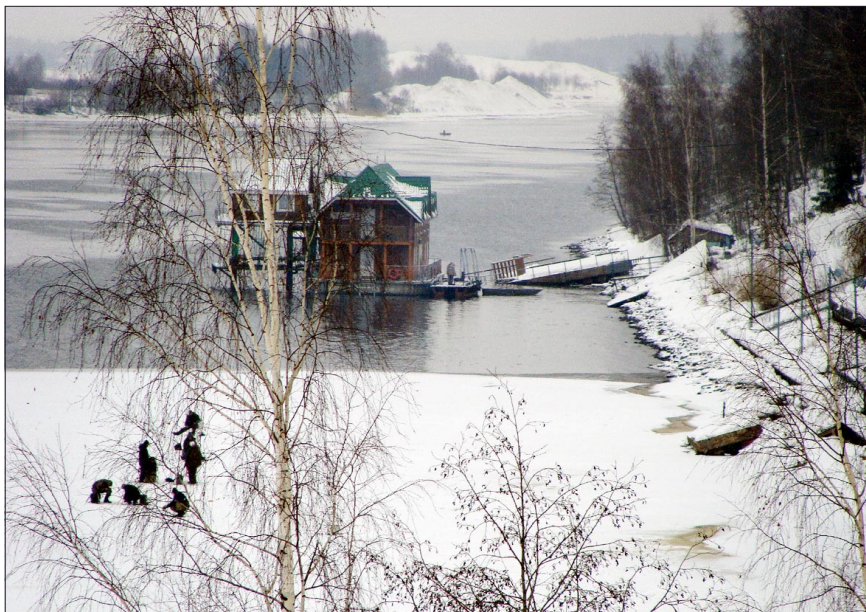
По данным отдела радиационной безопасности ОИЯИ, радиационный фон в Дубне 18 января 2012 года составил 0,08–0,1 мкЗв/час.

сударственных музеев региона начали действовать новые цены на вход и съемку. Максимальная стоимость билета в 2012 году составит 350 рублей, при этом входная плата в музеи для взрослых граждан не должна превышать 250 рублей, детский билет не может стоить дороже 150 рублей. Один экскурсионный час с обслуживанием на русском языке в подмосковных музеях будет стоить не дороже трех тысяч рублей, а на иностранном языке – четырех. За любительскую фотосъемку необходимо будет заплатить до 500 рублей, за профессиональную – до 10 тысяч.