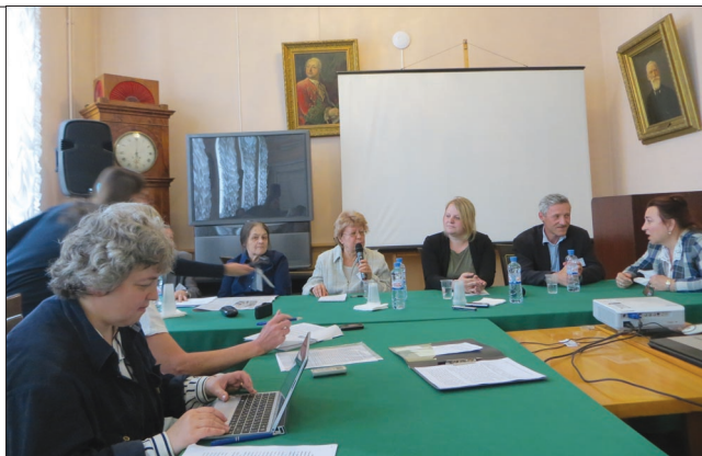
Специалисты из России и Германии, увлеченные судьбой Тимофеева-Ресовского.