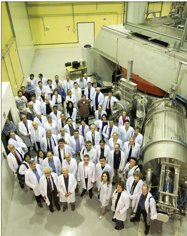
Циклотрон ДЦ-280 стал визитной карточкой Лаборатории ядерных реакций. В конце мая 2019 года, объявленного Годом периодической таблицы, в зале циклотрона побывали участники Международного симпозиума «Настоящее и будущее Периодической таблицы химических элементов».

– Надо сказать, я не знаю, трудный это период или легкий. Мне пока не с чем сравнить. Мне кажется, он был трудный, но уверен, что бывают времена и потруднее. Самые забавные трудности были филологического характера. Ока-