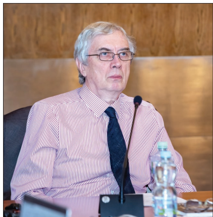
Вице-директор ОИЯИ академик Б. Ю. Шарков

1. Картина должна измениться радикально гораздо раньше, чем через 10-20 лет. Так, очереди на проходной исчезнут, так как пропускная цифровая система будет действовать на основе распозна-