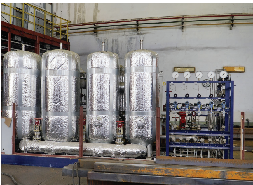
Блок маслоочистки и осушки гелия МО-800.

Галина МЯЛКОВСКАЯ