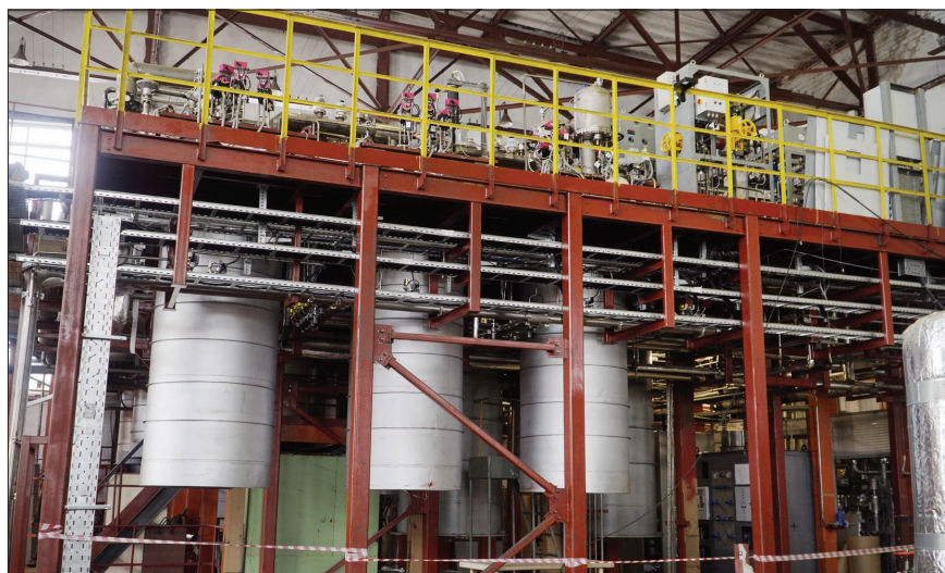
Гелиевый спутниковый рефрижератор РСГ-2000/4,5 для охлаждения бустера.

– Первые такие турбины были сделаны в конце 80-х – начале 90-х годов и опробованы на криогенном комплексе Нуклотрон на установках КГУ-1600/4,5. Применение этих парожидкостных турбин вместо дроссельного вентиля позволи-