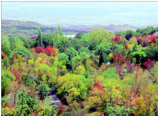
и вид, открывающийся с нее на Бюракан и Ереван.