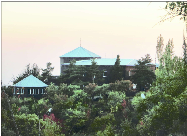
Научная станция Нор Амберд ЕрФИ...