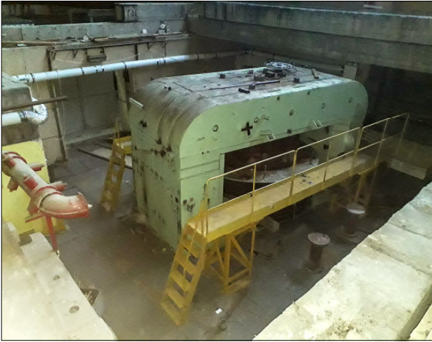
Фото 1. Магнит циклотрона У-200, начало демонтажа

В Лаборатории ядерных реакций имени Г. Н. Флёрва продолжаются работы по созданию ускорительного комплекса ДЦ-140