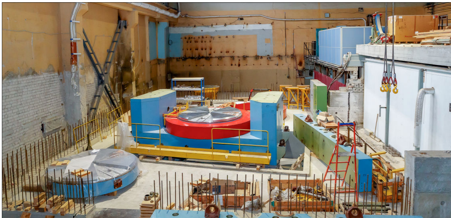
Фото 3. В процессе монтажа магнита ДЦ-140